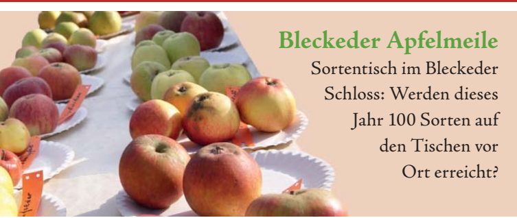
Bleckeder Apfelmeile Sortentisch im Bleckeder Schloss: Werden dieses Jahr 100 Sorten auf den Tischen vor Ort erreicht?