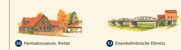
36 Heimatmuseum, Vietze 33 Eisenbahnbrücke Dömitz