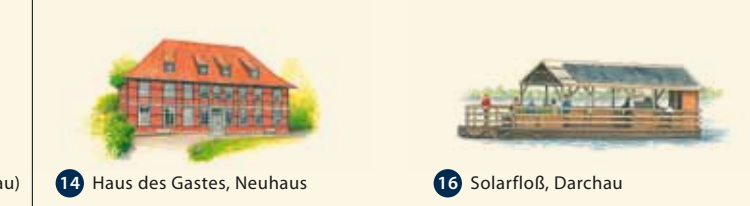
14 Haus des Gastes, Neuhaus 16 Solarfloß, Darchau