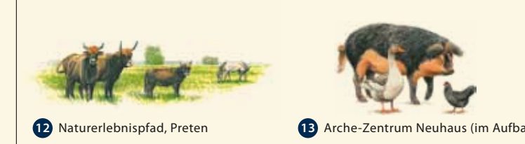
12 Naturerlebnispfad, Preten 13 Arche-Zentrum Neuhaus (im Aufbau)