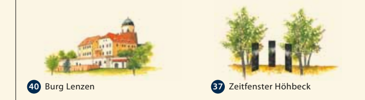
40 Burg Lenzen 37 Zeitfenster Hühbeck