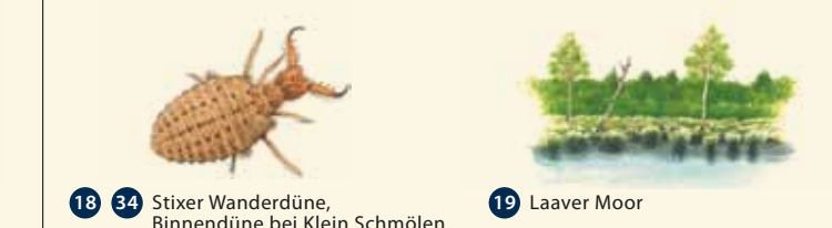
18 34 Sticker Wanderdüne, Binnendüne bei Klein Schmölen 19 Laaver Moor