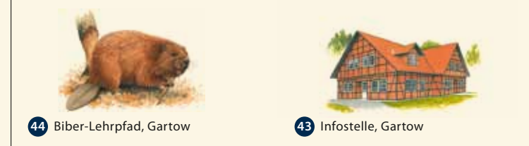
44 Biber-Lehrpfad, Gartow 43 Infostelle, Gartow