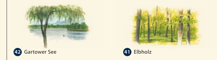
42 Gartower See 41 Elbholz