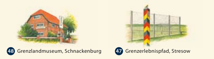
48 Grenzlandmuseum, Schnackenburg 47 Grenzerlebnispfad, Stresow