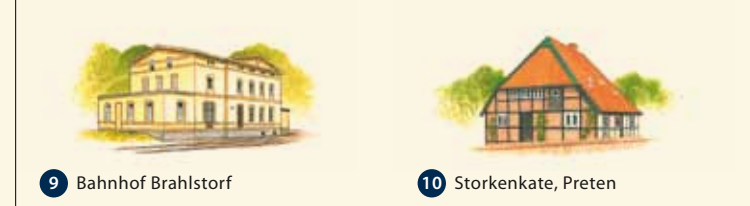
9 Bahnhof Brahlstorf 10 Storkenkatze, Preten