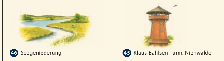
46 Seegeniederung 45 Klaus-Bahlsen-Turm, Nienwalde

Maßstab: 1 cm in der Karte entspricht ca. 1,75 km in der Natur