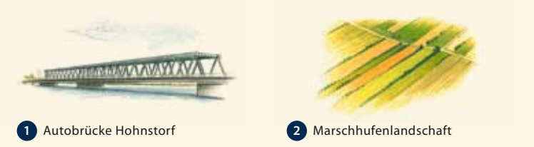
1 Autobrücke Hohnstorf 2 Marschhufenlandschaft