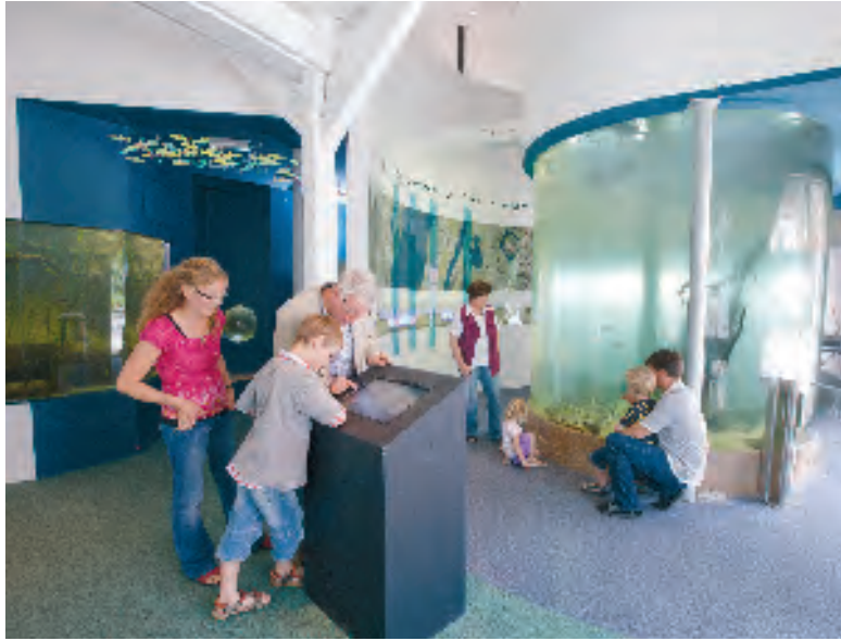
In den Aquarien lassen sich die Fische der Elbe beobachten.