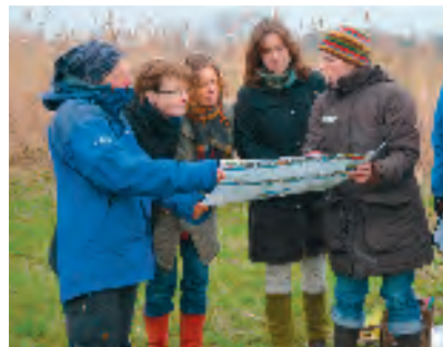
Natur- und Landschaftsführer/-innen wissen, wo es langgeht.