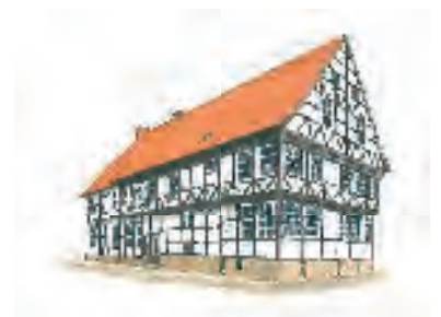
Museum Hitzacker (Elbe) Das Alte Zollhaus

Einige dieser nachhaltig wirtschaftenden Einrichtungen, die auch Führungen anbieten, präsentieren sich auf den nächsten Seiten. Mit dabei sind u.a. viele Museen, Partnerbetriebe aus der Arche-Region und Naturschutzverbände.