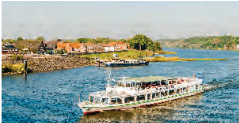
Natur und Kultur erleben, Flussschiffahrt gehört dazu.