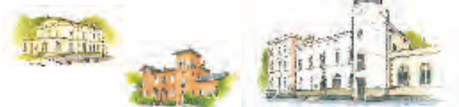
Die Bahnhöfe Brahlstorf, Hitzacker und Dannenberg sind die Eingangstore in das Biosphärenreservat

Dies ist auch der Grund, warum sich das Biosphärenreservat am „Fahrtziel Natur“ der deutschen Bahn beteiligt. Bei dieser schon seit vielen Jahren laufenden Aktion bewirbt die Bahn die deutschen Großschutzgebiete. Anreisebahnhöfe für die niedersächsische Elbtalaue sind der Biosphären-Bahnhof in Brahlstorf sowie die Bahnhöfe Hitzacker und Dannenberg. Von den nächstgrößeren Städten Lüneburg, Salzwedel, Ludwigslust und Uelzen aus kann das Gebiet mit Bussen erreicht werden.