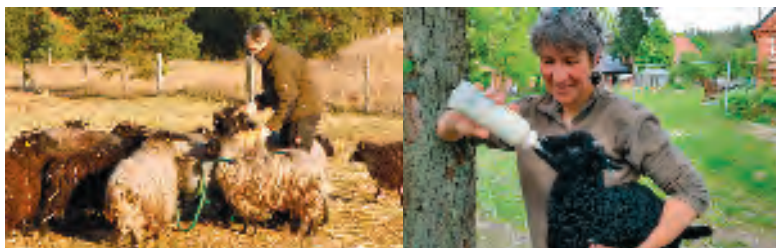
Gabi Esser und die Heidschnucken