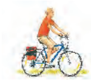
Radtourismus ist eine Form des naturverträglichen Tourismus

Deutsche Biosphärenreservate repräsentieren einzigartige Natur- und Kulturlandschaften. Das Biosphärenreservat Niedersächsische Elbtalau ist eines von 15 UNESCO-Biosphärenreservaten in Deutschland. Diese stehen, eingebunden in das weltweite Netz der UNESCO-Biosphärenreservate, für international repräsentative Modellregionen. Hier soll eine nachhaltige Entwicklung in allen Wirtschafts-