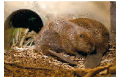
Der Biber kann in seinem Bau besucht werden.

April bis Oktober täglich von 10 bis 18 Uhr, November bis März mittwochs bis sonntags von 10 bis 17 Uhr