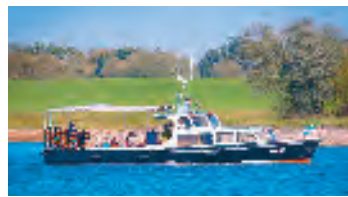
Die MS Hecht

Seeadler, Kormoran, Graureiher, Gänse und verschiedene Enten, so könnte die Artenvielfalt aussehen, die auf der Beobachtungsliste der geführten Entdeckungstour steht.