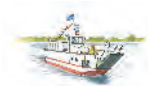
Radfahrer und Wanderer kommen fast überall hin. So auch über die Elbe mit der kleinen Fußgänger- und Radfahrerfähre Hitzacker

Um Land und Leute kennen zu lernen, benötigt man immer ein Mindestmaß an Mobilität. Insbesondere in ländlichen Räumen, wie dem Biosphärenreservat, ist Mobilität ohne Auto nicht immer einfach. Nachhaltige Mobilität ist von daher ein Thema, was einen besonderen Stellenwert in der Elbtalaue hat.