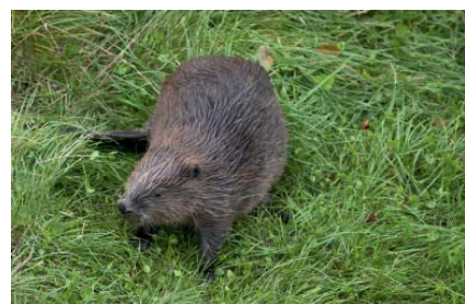
Biber live im Biosphaerium beobachten

Während sich Spuren der Elbe-Biber wie angenagte Stämme recht häufig finden lassen, bleiben die Tiere selbst meist unsichtbar. In unserer Biberanlage können Sie Meister Bockert in aller Ruhe an Land, im Wasser oder direkt in seiner Burg beobachten. Der Blick vom 20 m hohen Aussichtsturm lädt ein zu einem Ausflug in die Elbtalaue. Aber vielleicht stärken Sie sich vorab noch im Café Fritz auf dem Schlosshof, während die Kleinen sich den burgenhaften Spielplatz erobern?