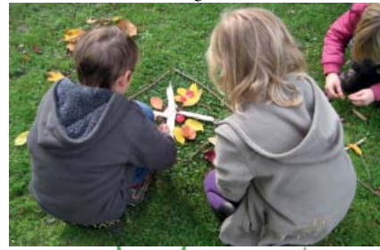
Umweltentdeckungen im Elbdeichvorland

Ob „Baumeister Biber“, „Gans wild“ oder „Störche live erleben“: Unter dem Motto „Umwelt erleben, erforschen und gestalten“ ergründen wir mit Kindergärten und Schulklassen die Vielfalt des Biosphärenreservates Niedersächsische Elbtalaue. Kinder und Familien finden bei uns eine Fülle an abwechslungsreichen Aktionen für die Ferien, den Kindergeburtstag oder Ihre Familienfeier. Ob bei Ihrem nächsten Vereins- oder Betriebsausflug: Genießen Sie bei Ihrer nächsten Landpartie eine Führung im Biosphaerium und lernen Sie auf unterhaltsame Weise die Tierwelt der Elbtalaue kennen.