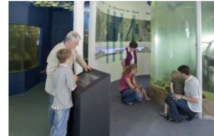
Elbfische in der Aquarienlandschaft erleben

Direkt am Deich gelegen, ist das Biosphaerium Elbtalaue als Informationszentrum für das Biosphärenreservat Niedersächsische Elbtalaue der ideale Ausgangspunkt für Ihre Tour an der Elbe. Die interaktive Ausstellung bietet für jede Generation abwechslungsreiche Einblicke in die naturkundlichen Besonderheiten der Region. Da laden z. B. das Vogelstimmenklavier, das Windrad oder das Rotmilan-Spiel ein, selbst aktiv zu werden.