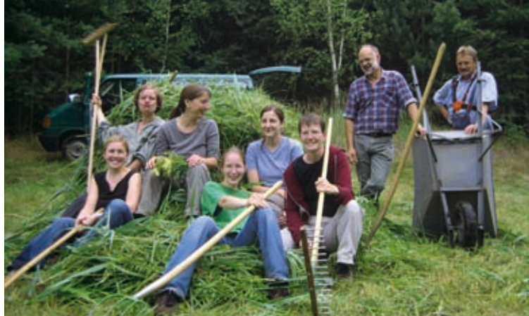
Im Einsatz zum Schutz von Feuchtwiesen

Schutzgebiete sind zudem auf Unterstützer und Unterstützerinnen angewiesen, die sich in vielfältiger Weise ehrenamtlich für sie einsetzen und somit zu aktiven „Insidern“ werden. Diese Freiwilligen ersetzen keine Hauptamtlichen; durch ihren Einsatz ergänzen und bereichern sie die Arbeit Hauptamtlicher und sind damit wertvolle Partnerinnen und Partner im Team der Schutzgebietsbetreuung.