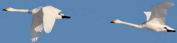
Singschwäne im Flug