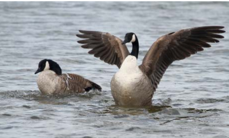
Kanadagänse auf dem Wasser

Parallel zu den Nordischen Gastvogeltagen können Sie im Biosphaerium Elbtalaue die Sonderausstellung „Nordische Gastvögel in der Elbtalaue“ besichtigen. Die Ausstellung gibt einen Überblick über die unter diesem Stichwort zusammengefassten Vogelarten, ihre Zugrouten in die Elbtalaue, bestehende Konflikte und Lösungsansätze, aber auch Möglichkeiten des Naturerlebens in den Wintermonaten.