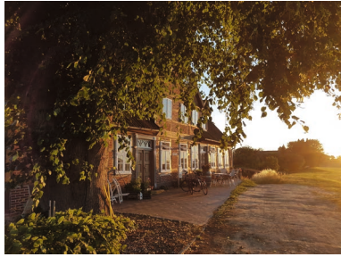
Marschdeich 1 in Bleckede

Am Marschdeich in Bleckede wirkte im 19. Jahrhundert der aus Northeim bei Hannover stammende Amtmann und Wasserbauinspektor Christian Bertram .