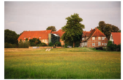
Blick auf Schloss und Gebäude am Marschdeich 1

zum Komplex des Bleckeder Schlosses, welches sich vis à vis östlich der Schlossstraße befindet. Es wurde ca. 1600 als Burglehen und Amtssitz zur Regierungszeit von Herzog Ernst II.