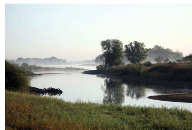
Elbe am „Eckermann-Weg“ im Morgennebel

Überliefert ist, dass Eckermann gerne mit seinem Hannchen an der Elbe entlang bis zum Heisterbusch spazierte. Dort befand sich noch bis zum Hochwasser im Jahre 2013 ein beliebtes