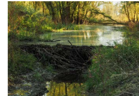
Biberdamm im Leipgraben