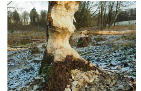
Nagespuren des Bibers