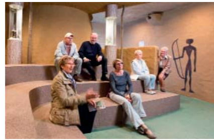
Gruppenführung im Biberbau

Gruppenangebote Ob bei Ihrem nächsten Vereins-, Betriebsausflug oder Ihrer privaten Feier: Genießen Sie Ihre nächste Landpartie im Biosphaerium. Lernen Sie bei einer Führung auf unterhaltsame Weise die Elbtalaue und ihre Tierwelt kennen. Zusammen mit unserem kulinarischen Angebot, einer Kutsch- oder Draisinentour bzw. einer Elbschiffahrt erleben Sie einen abwechslungsreichen Tag.