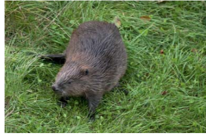
Biber live im Biosphaerium beobachten

Während sich Spuren der Elbe-Biber wie angenagte Stämme recht häufig finden lassen, bleiben die Tiere selbst meist unsichtbar. In unserer Biberanlage können Sie Meister Bockert in aller Ruhe an Land, im Wasser oder direkt in seiner Burg beobachten. Der Blick vom 20 m hohen Aussichtsturm macht schon Lust auf einen Ausflug. Aber vielleicht stärken Sie sich vorab noch in unserem Café auf dem Schlosshof, während die Kleinen sich den burgenhaften Spielplatz erobern? Schließlich hält unser Shop mit regionalen Produkten auch jede Menge Souvenirs und Geschenkideen für Sie bereit.