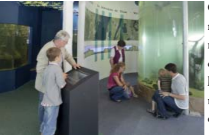
Elbfische in der Aquarienlandschaft erleben

Das Biosphaerium Elbtalaue Direkt am Deich gelegen, ist das Biosphaerium Elbtalaue als Informationszentrum für das Biosphärenreservat Niedersächsische Elbtalaue der ideale Ausgangspunkt für Ihre Tour an der Elbe. Mit unserer interaktiven Ausstellung bieten wir für jede Generation abwechslungsreiche Einblicke in die naturkundlichen Besonderheiten der Region. Da laden z. B. das Vogelstimmenklavier, das Windrad oder das Rotmilan-Spiel ein, selbst aktiv zu werden. Doch manches bleibt einem bei einer noch so schönen Tour an der Elbe (fast) immer verborgen. Deshalb bieten wir mit unserer Aquarienlandschaft die einmalige Möglichkeit, von Aal bis Zander zahlreiche Fischarten der Elbe kennenzulernen.