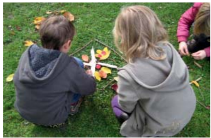
Umweltentdeckungen im Elbdeichvorland

Umweltentdeckungen Unter dem Motto „Umwelt erleben, erforschen und gestalten“ ergründen wir mit Kindergärten und Schulklassen die Vielfalt des Biosphärenreservates Niedersächsische Elbtalaue. Bei uns können die Gruppen „Gans wild“ nordische Gastvögel kennen lernen, Aufschlussreiches über „Baumeister Biber“ erfahren, in „Wiesenwelten“ eintauchen, „Störche live erleben“ und vieles mehr. Gern passen wir unsere Angebote dabei Ihren Vorstellungen und Wünschen an. Für Kinder und Familien finden Sie bei uns eine Fülle an abwechslungsreichen Aktionen. Wir gestalten Ihrem Kind einen spannenden Geburtstag, geben den Schulferien farbenfrohe Tupfer und gehen mit Groß und Klein auf Entdeckungstour. Machen Sie sich auf, neue Umwelten zu entdecken und erleben Sie ereignisreiche Momente in der Elbtalaue.